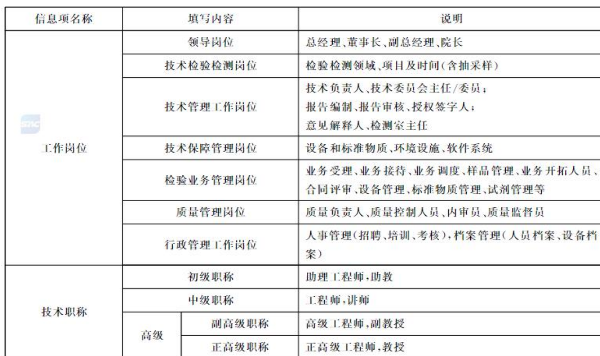
表 C.1 检验检测机构工作岗位与技术职称分类