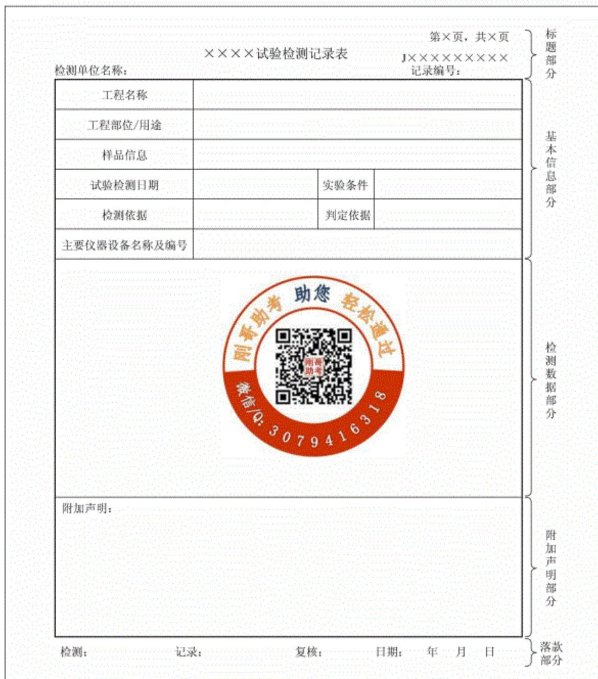
图 A.1 记录表格式

以土击实试验、混凝土强度两个参数为例给出记录表实例,分别参见图 A.2、图 A.3,图中斜体内容为手写。